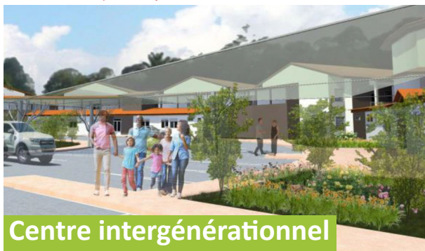
Centre intergénérationnel de Macouria

Pour faire face aux besoins en termes de logement et de prise en charge des personnes âgées en Guyane, un projet de construction d'un complexe intergénérationnel comprenant la première résidence seniors du département devrait être lancé dès le mois de novembre sur la commune de Macouria.